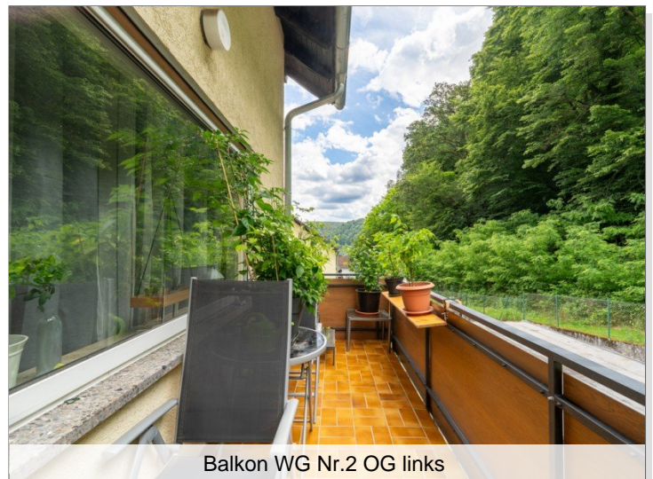
Balkon WG Nr.2 OG links