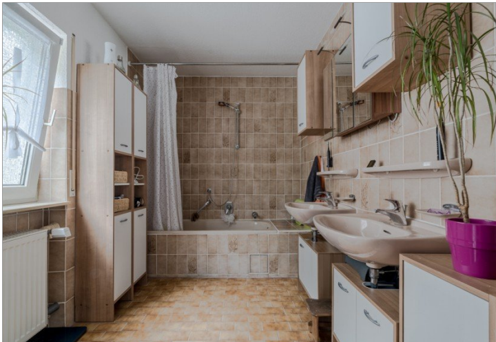
Bad WG Nr.2 OG links