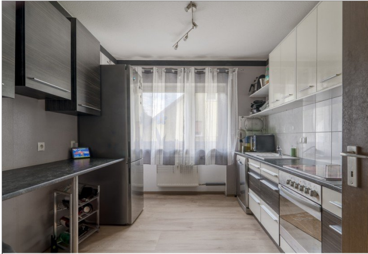
Küche WG Nr.2 OG links