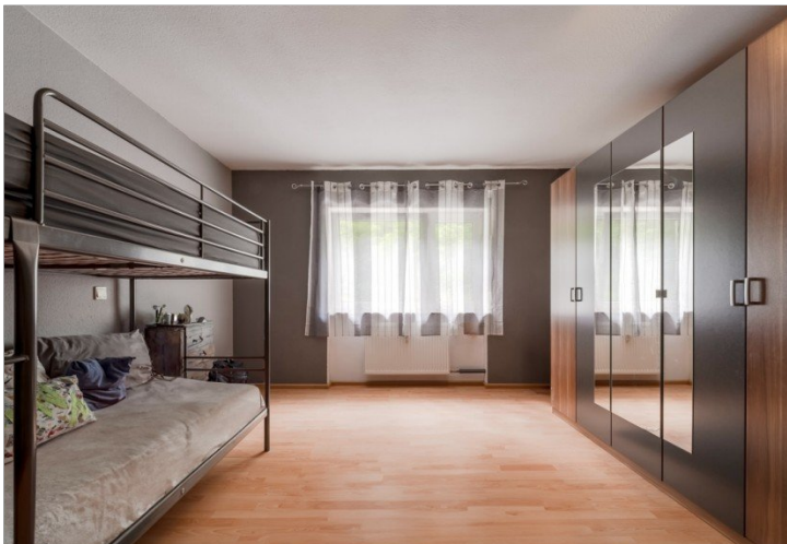
Schlafzimmer WG Nr.2 OG links