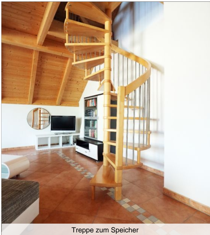
Treppe zum Speicher